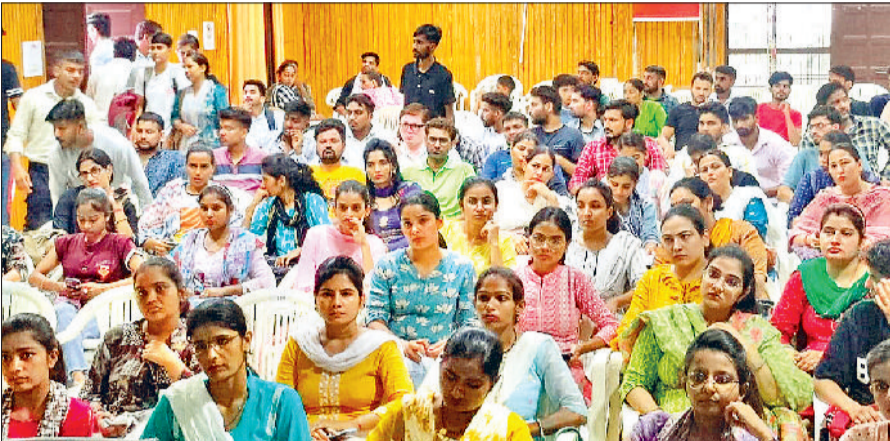
रोहतक। कार्यशाला में उपस्थित नगर निगम कार्यालय के कर्मचारी, कार्यशाला को सम्बोधित करते हुए उप नगर निगम आयुक्त जितेंद्र कुमार।