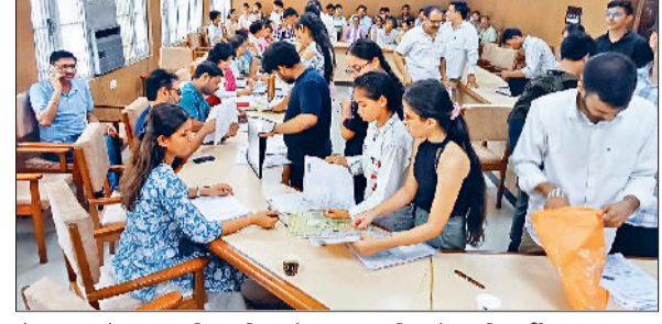
रोहतक। प्रवेश काउंसलिंग प्रक्रिया में प्रमाण पत्र दिखाते हुए विद्यार्थी।