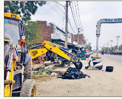
हिसार रोड स्थित नाले की सफाई करती जेसीबी।

नगर निगम की चार टीमों ने दिनभर अलग-अलग एरिया में नालों की सफाई करवाई। इस दौरान गोहना अड्डा के पास स्थित नाले की सफाई करवाई गई। अब तक टीम गांव बोहर, दिल्ली रोड, सोनीपत रोड, गोहना रोड, जींद रोड, भिवानी चूंगी, छोट्टराम चौक आदि एरिया में सफाई करवा चुकी है।